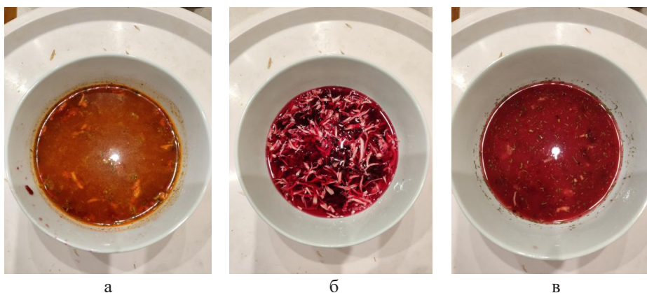
Рисунок 1 – Борщ: а – шматочками з томатами, б – шматочками з буряком, в – борщ гомогенний з буряком