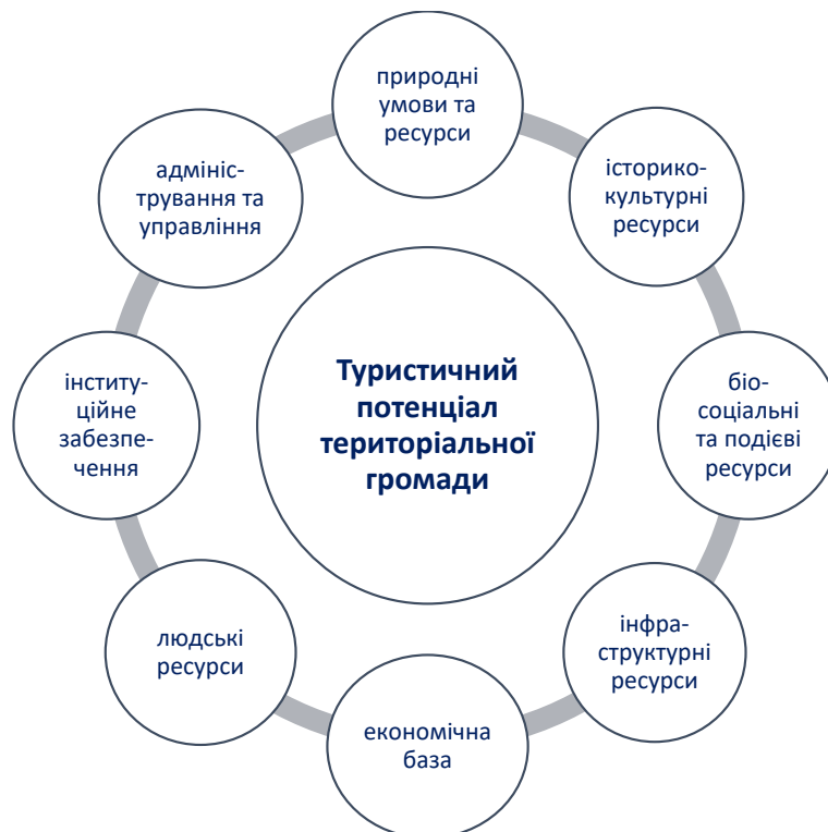
Рисунок 3 – Складові туристичного потенціалу територіальної громади

Екологічні критерії. Екологічний контекст розвитку зараз є детермінований головно через війну. Проте,