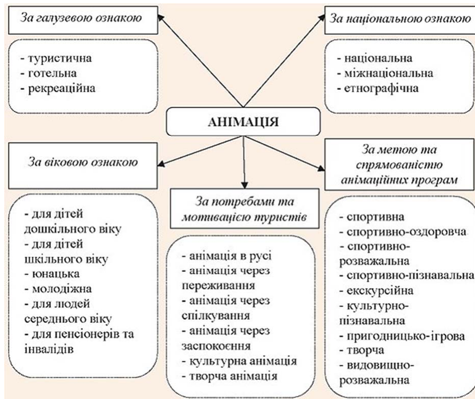
Рисунок 2 – Класифікація анімаційних послуг у туризмі

Анімація є туристичною послугою, що надається у процесі подорожі та відпочинку й передбачає залучення мандрівників до активної участі у анімаційно-розважальних програмах. Значення туристичної анімації полягає у підвищенні якості, привабливості й різноманітності послуги, що призводить до підвищення обсягу постійних клієнтів і попиту на туристичний продукт, збільшення ефективності застосування матеріально-технічної бази готелю, туристичного комплексу, дитячого табору або торгівельного центру й, відповідно, до збільшення його доходності й рентабельності.